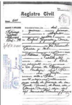
Certificado de defunción.

Como reconocimiento a su labor, le fue concedida la Medalla del Mérito Agrícola por el rey Alfonso XIII.