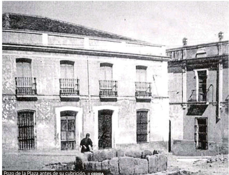
Pozo de la Plaza antes de su cubrición.

mo, se acordó abonar 25 pesetas como donativo del Ayuntamiento para la suscripción nacional para erigir un monumento a la reina María Cristina. Por último, con cargo a imprevidos, se pagaron cinco pesetas al hermano Cándido