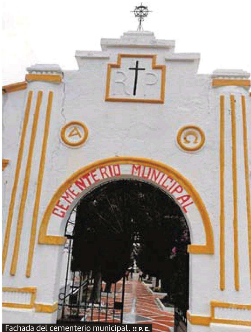
Fachada del cementerio municipal.