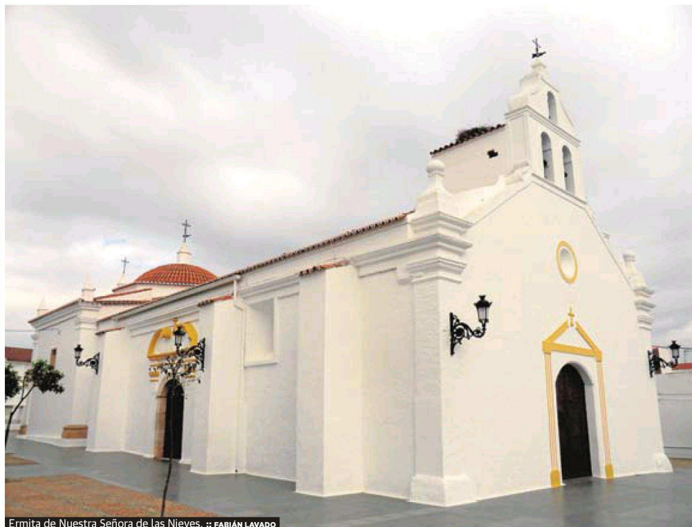
Ermita de Nuestra Señora de las Nieves.

El libro de actas de la Comisión Permanente recoge cuestiones de muy diversa índole, como los cuentas para ese año