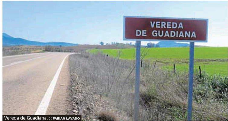
Vereda de Guadiana. :: FABIÁN LAVADO

Sigue lindando por la izquierda con la Dehesa de Holgado y por la derecha con Suerte del Rey, pasando por la parte alta de la Solana de los Riscos, siguiendo lindando por la derecha con Suerte del Rey y por la izquierda con la dehesa de los Concejiles, pasando por Los Cerrajones, dejando a la izquierda, próximo, el mirador de Don Augusto. Sigue por la derecha lindando con Suerte del Rey y por la izquierda Los Concejiles, con mojones de piedra sobre la linde izquierda, continuando por la derecha con parcelas del cerro de la Encina y, al llegar a la carretera de Mérida a Alange, termina uniéndose en este sitio a la Cañada Real de La Zarza o de Aguas de Verano. Sigue una dirección aproximada de oeste a este. Su longitud es de unos 3.500 metros y su anchura, de 37,61 metros.