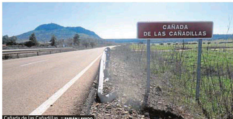
Cañada de las Cañadillas. :: FABIÁN LAVADO

La vía principal era la cañada, tradicionalmente conocida como cañada real, denominación que proviene de la época del rey Alfonso XI, quien dada la importancia que tenían las vías pecuarias para el negocio de la lana las puso bajo protección real. Posteriormente, Enrique IV –por una Real Carta– colocó estas vías bajo su dominio directo. Quedaba, por tanto, prohibido el recorte que realizaban habitualmente los propietarios de fincas colindantes mediante el movimiento de mojones. La cañada real debía tener una anchura de 90 varas castellanas (75,22 metros) y su trazado, que discurría de norte a sur salvando las limitaciones geográficas, era de largo recorrido, superior a 500 kilómetros. Las cañadas más importantes a su paso por Extremadura eran: la Cañada Real Leonesa Occidental, la Cañada Real Leonesa Oriental, la