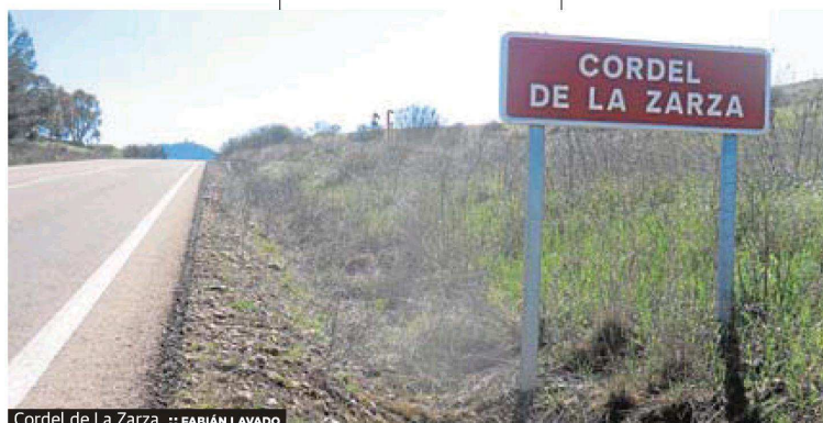
Cordel de La Zarza.

Cañada Real Soriana Occidental, la Cañada Real Segoviana, la Cañada Real de la Plata y la Cañada Real de Gata.