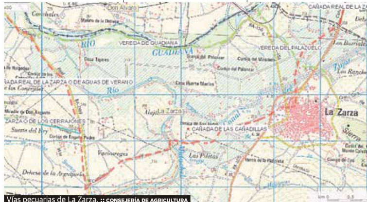
Vías pecuarias de La Zarza. :: CONSEJERÍA DE AGRICULTURA